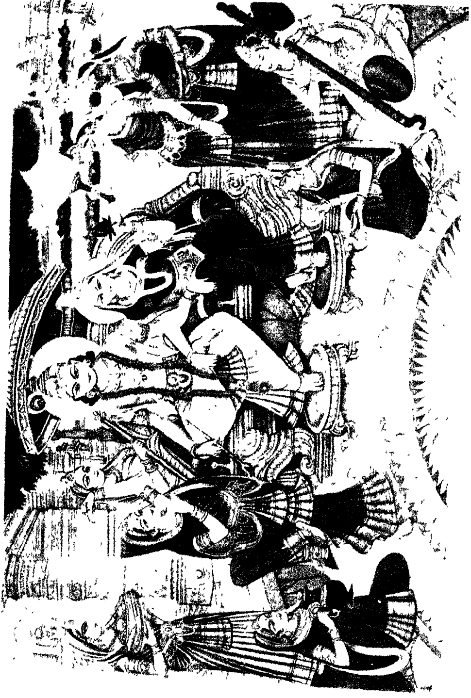
गोलिकाधिपति भगवान श्रीगणेशमाश्रय